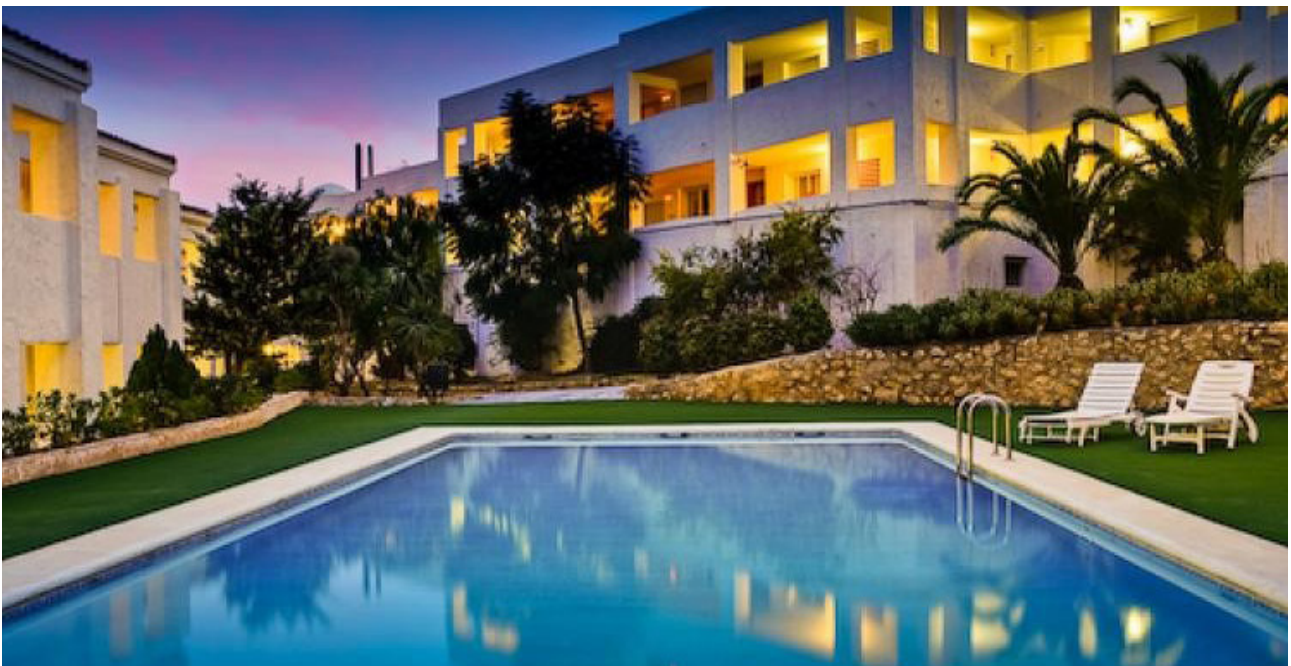
Zorgcentrum Residencia Montebello