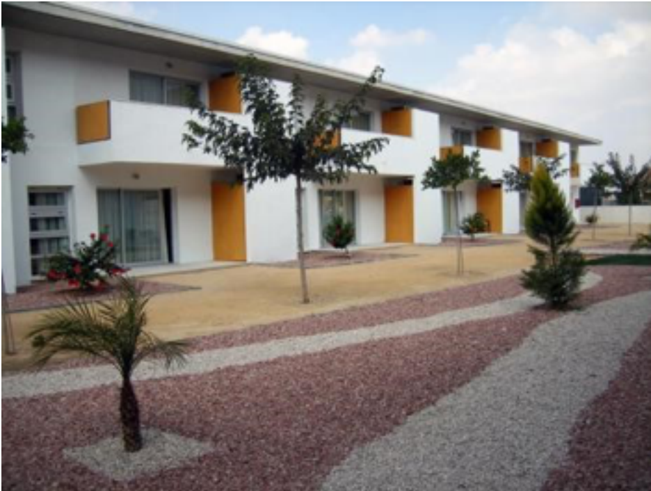
Zorgcentrum Casa Almorandi

Estudiantes werkt al enkele jaren samen met Spaanse (particuliere) ziekenhuizen, revalidatiecentra en zorgcentra. Deze liggen verspreid over verschillende gebieden. Noord is de regio Benidorm/Alfaz del Pi. Alicante ligt in het midden en in het zuiden liggen de plaatsjes Almoradi, Rojales, Pilar en Quardamar. In overleg met jou besluit Estudiantes welk leerbedrijf het beste bij je past.